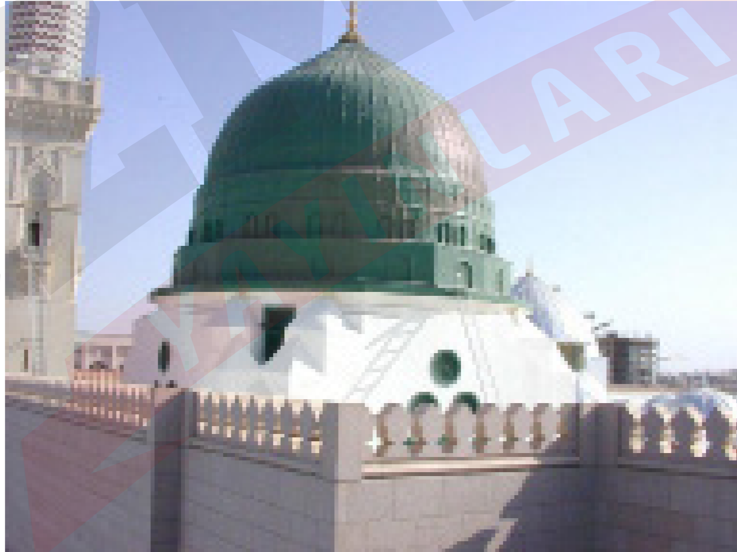
Mescid-i Nebevi ve Ravza-i Mutahhara