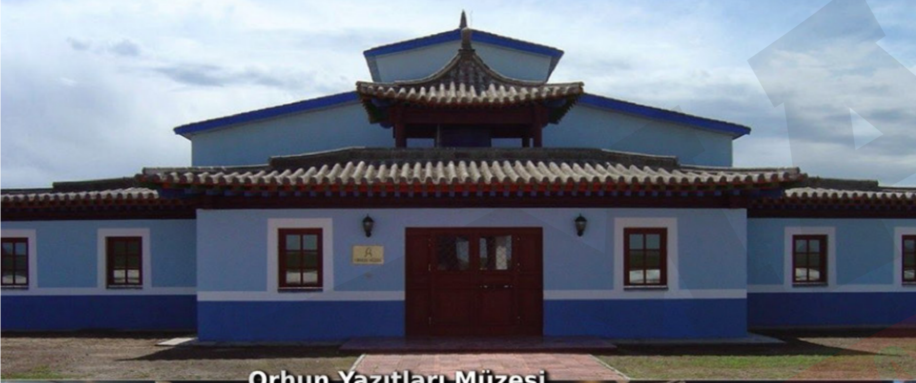
Orhun Yazıtları Müzesi