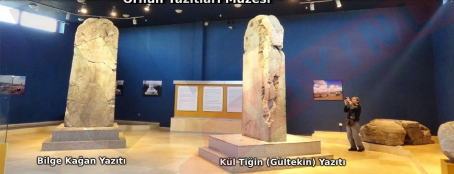
Bilge Kağan Yazıtı