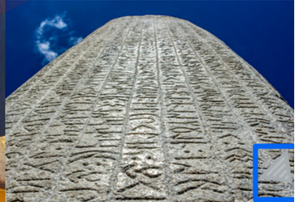
Kül Tiğın (Gültekin) Yazıtı