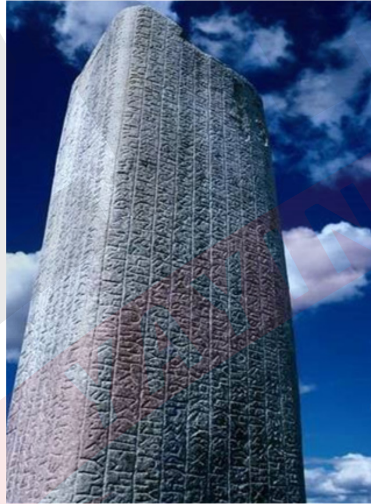
Bilge Kağan Yazıtı (II. Kök Türk)