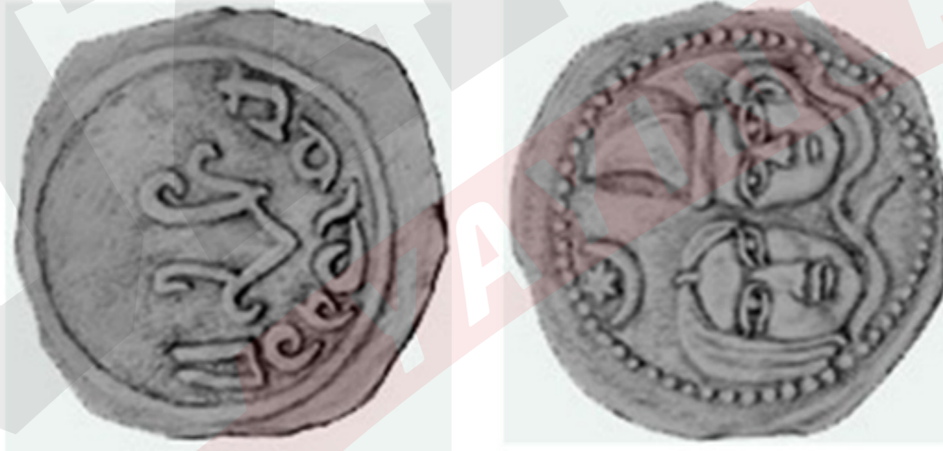
Kök Türk Parası